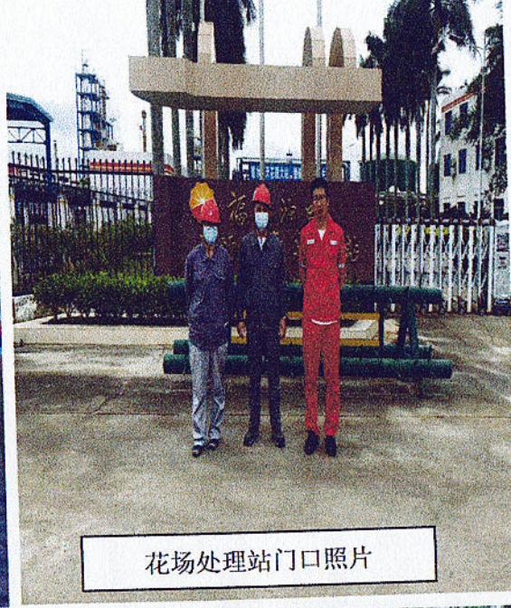
花场处理站门口照片