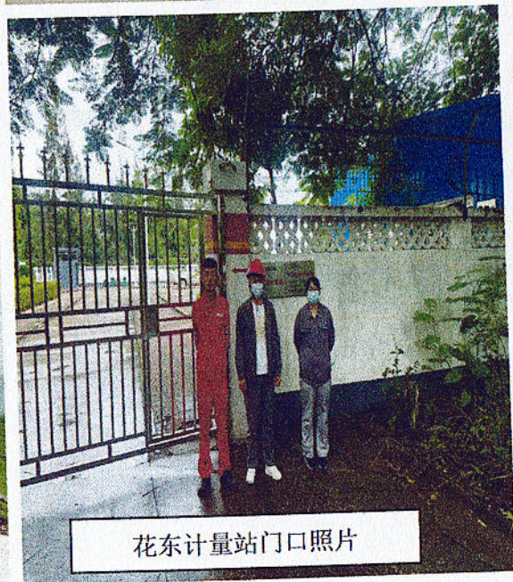
花东计量站门口照片